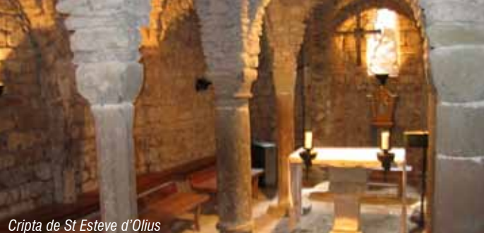
Cripta de St Esteve d'Olius

Caminar és una manera saludable de descobrir el nostre patrimoni natural, històric i cultural. Gaudim-ne tot respectant l'entorn i les propietats particulars.