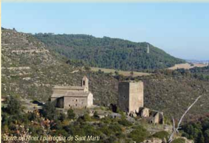
Torre de Riner i parròquia de Sant Martí

Arribem a la torre de Riner i veiem que està mínimament habilitada i que s'hi pot pujar. Tant la torre de Riner com la parròquia de Sant Martí són un excel·lent mirador de la vall del riu Negre i la rasa de l'Estany .