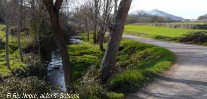
El Riu Negre, al fons, Solsona

Caminar és una manera saludable de descobrir el nostre patrimoni natural, històric i cultural. Gaudim-ne tot respectant l'entorn i les propietats particulars.