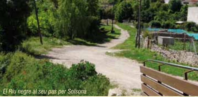
El Riu negre al seu pas per Solsona

Caminar és una manera saludable de descobrir el nostre patrimoni natural, històric i cultural. Gaudim-ne tot respectant l'entorn i les propietats particulars.