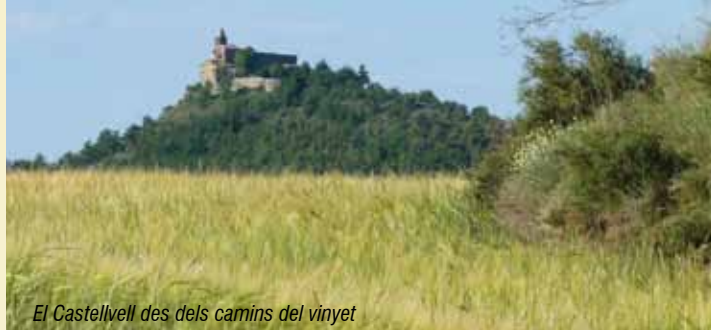
El Castellvell des dels camins del vinyet

Ara podem gaudir millor de magnífiques vistes de les serres de Querol, del Verd i d'Ensija, i fins i tot podem entreveure el Pedraforca i la serra del Cadí darrere d'aquestes primeres muntanyes. Girem cap a l'esquerra i baixem per la carretera enquitranada fins que, passat cal Pubill, agafem una pista a mà dreta. La seguim fins al final, creuem la C-149 pel pont i anem cap a la dreta fins a arribar a la carretera C-55. La creuem i prenem un corriol que baixa pel darrere de l'empresa de construcció. La seguim, tot endinsant-nos en els camps de cultiu de la zona nord del Vinyet. Creuem la rasa de Moriscots i després de cal Ramon girem a mà esquerra. Seguim la pista fins a arribar a la capella de Sant Honorat ; a la mateixa capella prenem el corriol que baixa i ens portarà fins al cementiri de Solsona. Ara creuem la carretera i pugem a mà esquerra fins a trobar el camí que coincideix amb la ruta de Sant Bartomeu. El seguim travessant la carretera LV-4241b fins a arribar al punt d'inici.